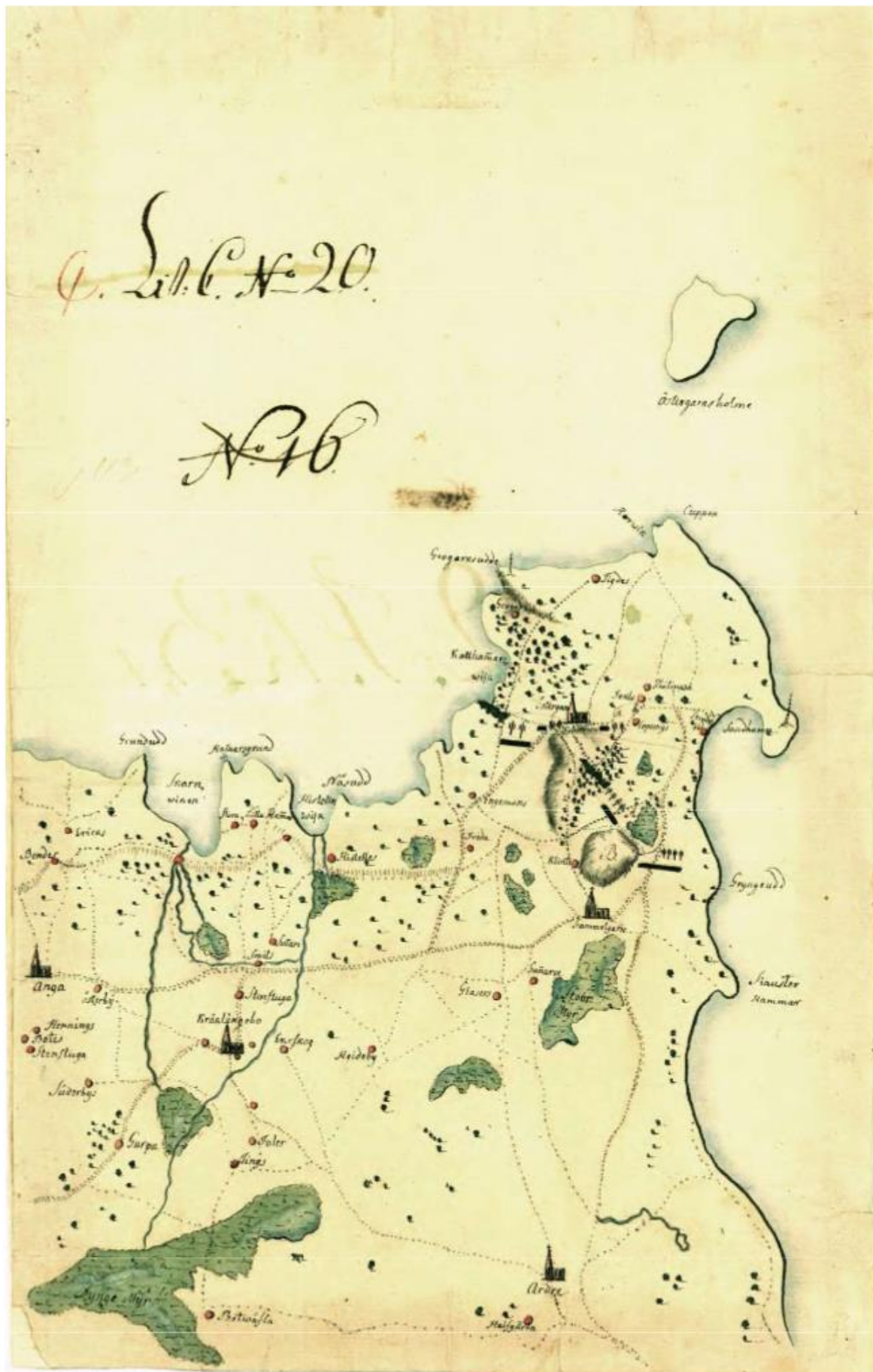
KrA 0400 Sverige, topografiska kartor Kartregnr: 0400:19B:004 Äldre beteckn: Anga-Östergarnsholme-Ardre...