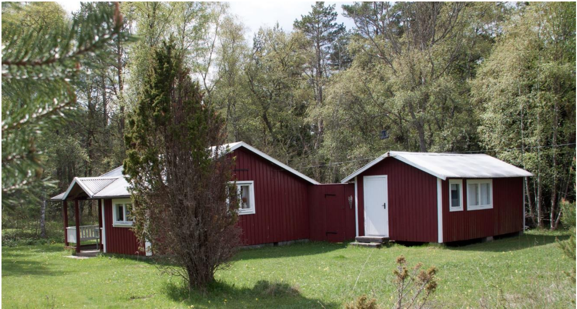
Bild på huset från 2014.