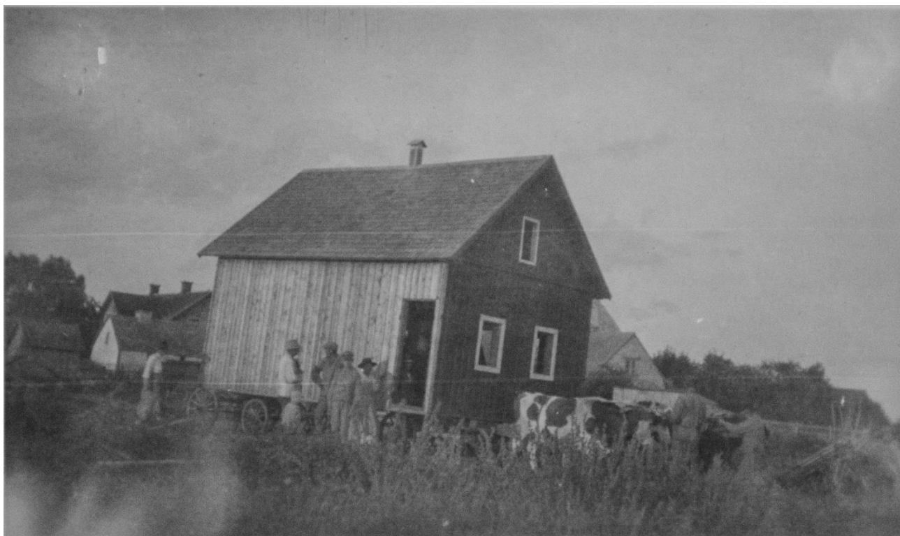
Flytten från Kräklingbo

Det hus de hyrde lär vara båtsmanstorpet 121 Strömberg som du kan läsa mer om under det kapitlet.